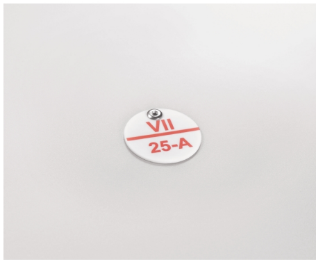
Изображение аналогичного изделия