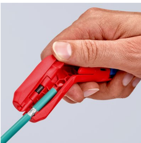
Удаление оболочки с дата-кабеля