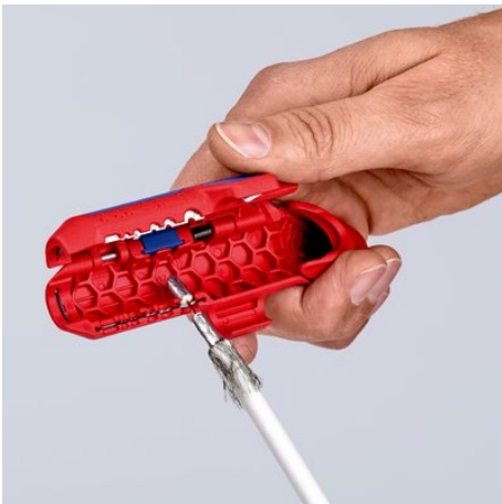
Удаление изоляции с коаксиального кабеля