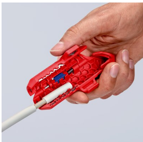
удаление оболочки с провода NYM