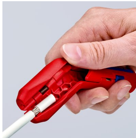
Удаление оболочки с коаксиального кабеля