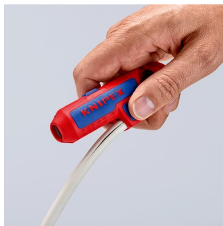
С лезвием для удобного продольного реза, скрытым в выступающем блоке с упором под большой палец