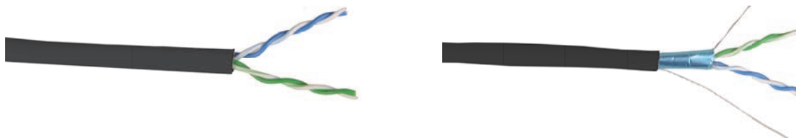
Вид кабеля в поперечном разрезе