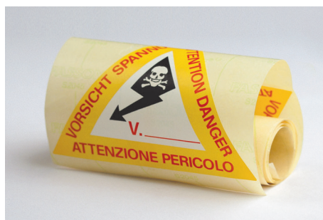
Наклейка со стороной 120 мм