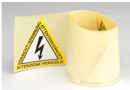
Наклейка со стороной 60 мм