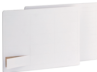
Пластины для нанесения надписей