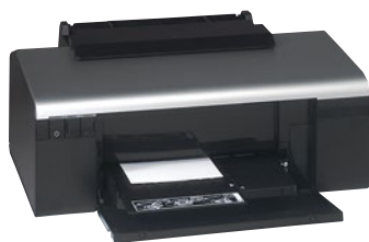
Подставка для жестких этикеток