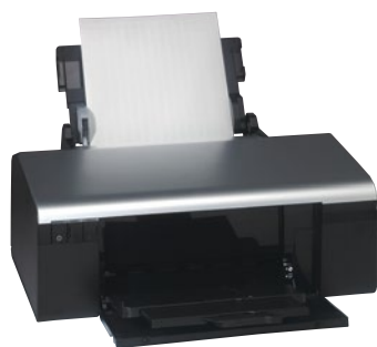
0 388 00

для кабелей, модульного оборудования, VDI, розеток, оборудования управления и сигнализации