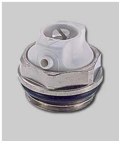
ВОЗДУХООТВОДЧИК РУЧНОЙ (КРАН МАЕВСКОГО) РАДИАТОРНЫЙ

Производитель: Demeta SRL, Via Corraducci 35, I - 60021 CAMERANO - (An) Tel : 00 39 / 071 72 13 337 Fax : 00 39 / 071 72 11 223 E-mail: demeta@demeta.it p.iva 01562010429