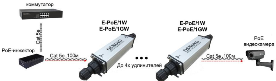
Рис. 7 Схема подключения удлинителей на примере модели E-PoE/1W, E-PoE/1GW