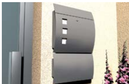
Крепление к штукатурным теплоизоляционным системам (ETICS)