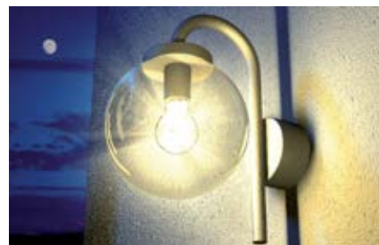
Крепление к штукатурным теплоизоляционным системам (ETICS)