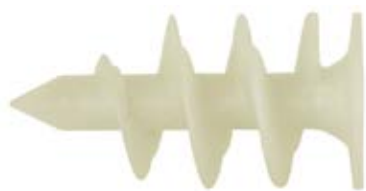
Дюбель для термоизоляции FID 50