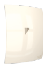
BREEZE 4C Ivory