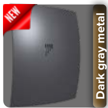
Dark gray metal