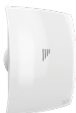
BREEZE 4C TURBO