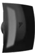
BREEZE 4C Obsidian