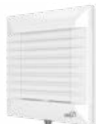
EURO 4A HT-02