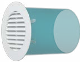
Типовой пример монтажа решетки RKL с круглым воздуховодом ВП.