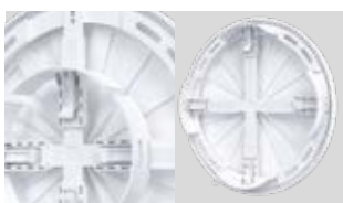
Регулируемый фланец (Ø от 90 до 160 мм).

Конструкция RKU позволяет регулировать расход воздуха. В зависимости от высоты, на которой установлена решетка, живое сечение регулируется флажком или шнурком.