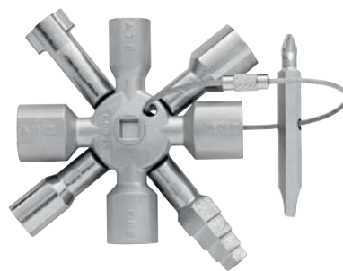
00 11 01