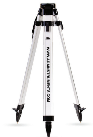
LIGHT APT. A00179